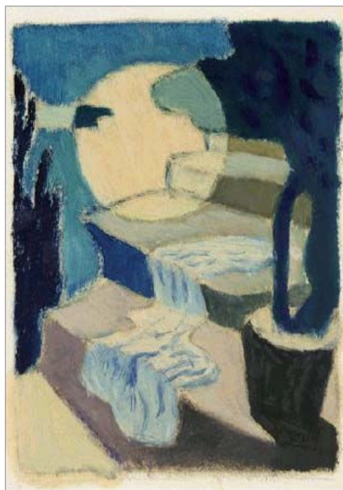
تصویر شماره ۴

زیادی از بوم را دربرگرفته و حاکی از دغدغه