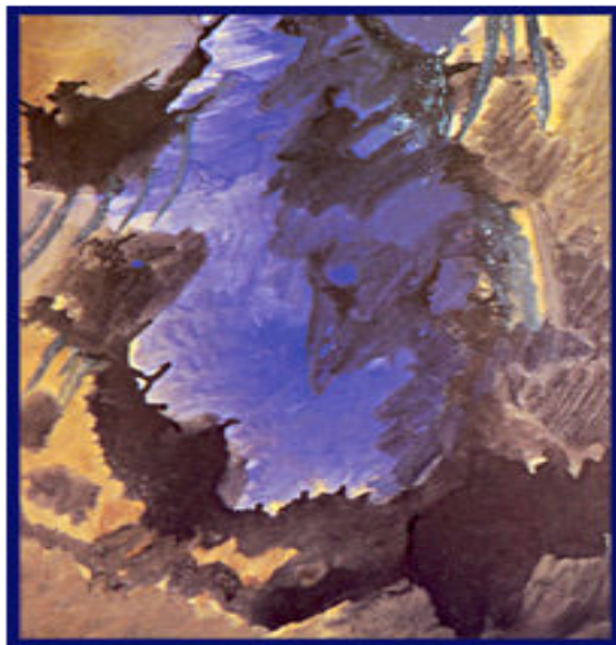
تصویر شماره ۵

عروج روحانی و سفر معنوی: شعر بالا و مضامینی که از آن برمی‌آید شاید بی‌ارتباط با تصویر شماره ۵ نباشد. در این تصویر، گویی من شاعر با طبیعت و هستی یکی شده و وی از میان درختان و از درون