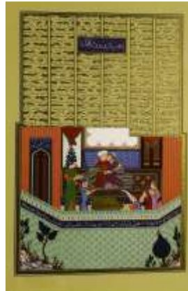
تصویر ۲. زال و رودابه (همان): (۶۲)