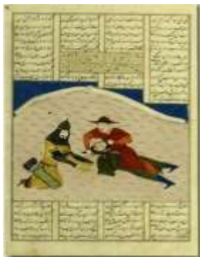
تصویر ۱۰. کشته شدن سیاوش (Abdullaeva-Melville, 2008, )

صحنه‌های مشابه استفاده نموده است. اما سوژه‌ها و نکات اصلی داستان را به خوبی ترسیم کرده است. بررسی‌ها نشانگر این مهم هستند که نگاره فریدون و ضحاک در نسخه شاهنامه بایسنغری نمونه کپی شده‌ای از نگاره‌ای با همان مضمون در شاهنامه مکتب تبریز اوایل قرن هشتم هجری موجود در کتابخانه توپقاپی استانبول (H.2153) می‌باشد (تصویر ۸). گرچه ترکیب کمی با نگاره استانبول فرق دارد اما الگوی اصلی این صحنه مشابه است؛ به خصوص در ترکیب بندی الگو، حرکات و تقسیم بندی پیکرها. در بخش‌های صخره‌ای هر دو نگاره پوشیده شده با گیاهان هستند که بعدها به الگوی اصلی اضافه شده است. احتمالاً زمانی که نگاره در آلبوم بوده است. این نسخه الگویی برای نسخه بایسنغری است. اما این نگاره از دیدگاه سیمز «مربوط به مکتب شیراز و دوره جلایری به تاریخ ۷۷۰ ق. می‌باشد» (Sims, 1992: 52).