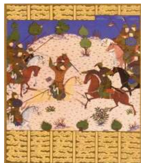
تصویر ۷. رستم و برزو (همان: ۲۵۷)