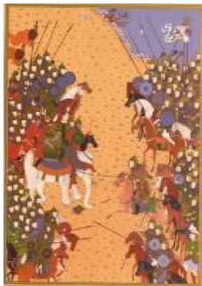
تصویر ۶. رستم و خاقان چین (همان: ۲۱۹)