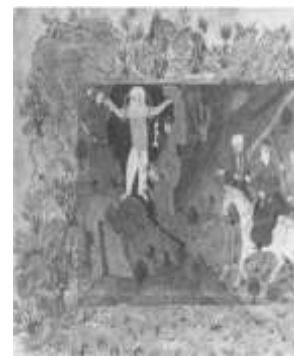
تصویر ۸. فریدون و ضحاک، شاهنامه مکتب تبریز