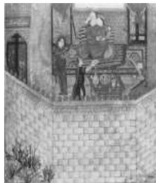
تصویر ۹. دیدار زال و رودابه، شاهنامه مکتب تبریز (ibid: )