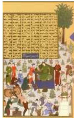
تصویر ۵. پادشاهی جمشید (همان: ۳۲)