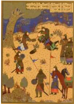
تصویر ۳. کشته شدن سیاوش (همان: ۱۶۳)