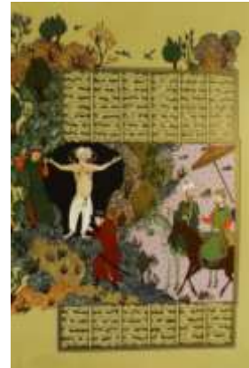
تصویر ۱. ضحاک و فریدون (فردوسی، ۱۳۵۰): (۴۱)